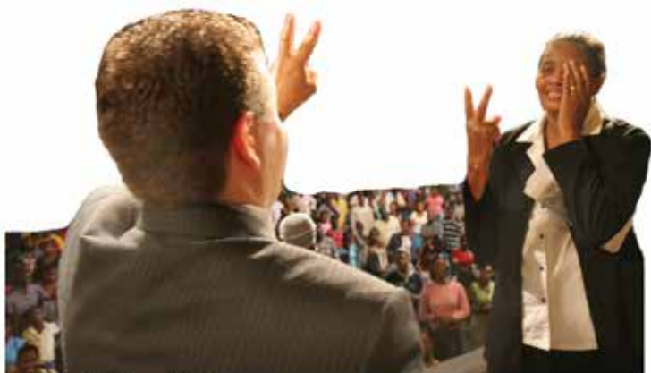
The Blind See